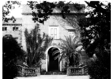
Le Guépard, villa Boscogrande à Palerme, résidence du prince

La partie de phrase choisie pour le titre « changer pour que rien ne change », extraite du livre de Lampedusa, Le Guépard , lui-même porté à l'écran par Visconti, souligne que les termes du thème de l'année sont non seulement ambivalents en économie, parfois fallacieux, mais aussi divers dans le contenu même des transformations , parfois au-delà des apparences.